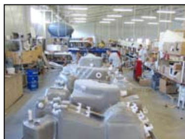
PRODUKTLINIE FÜR WHIRLPOOLS