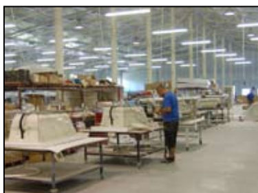
PRODUKTLINIE FÜR WANNE

Wir erweitern kontinuierlich unsere internationalen Beziehungen, damit unsere Grundstoffe den neuen Trends zusprechen und den aktuellen umweltfreundlichen Vorschriften entsprechen.