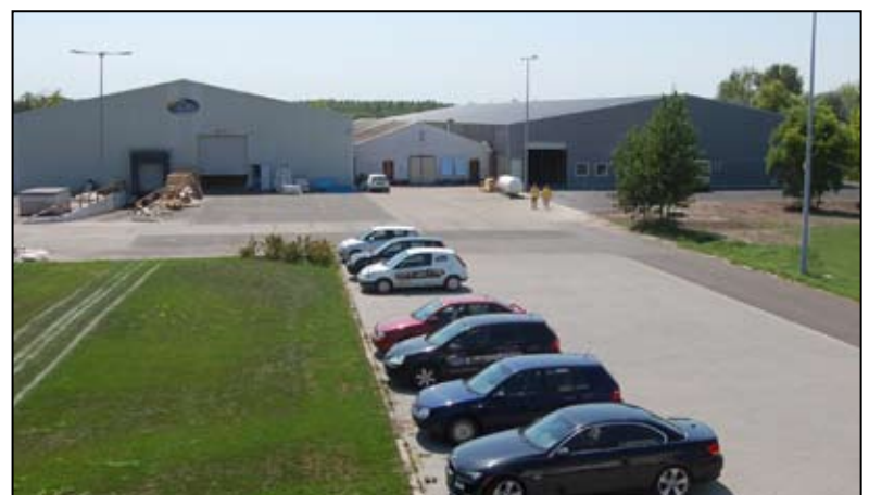
PRODUKTIONSFLÄCHE VON 7000 m 2

Wir glauben aber daran, dass wir mit harter und nachhaltiger Arbeit ein international akzeptiertes Produkt auf dem Markt einführen. Wir sind gefasst auf die weitere Herausforderungen und wir vertreten bis dahin Ungarn und Europa in der weiten Welt. Wir hoffen, dass immer mehr Menschen die WELLIS Produkte als täglichen Luxus wählen und dass wir damit an Ihrem Leben beteiligt sein können.