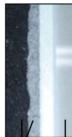
PU schaum Befestigung in mehreren Schichten 5/4 mm dick acryl Schicht

ABB Robotern arbeiten mit einer Genauigkeit von \pm 0,06 - 0,08 mm, was WELLIS überall der Welt eine ausgezeichnete Produktionsfirma macht. WELLIS nutzt Robotern im Laufe der Polyurethan-Streuung und der spanabhebenden Bearbeitung. Bei der Polyurethan-Streuung sind alle physischen und mechanischen Eigenschaften jeder Wanne- und Whirlpoolskörpers von ausgezeichneten Qualität.